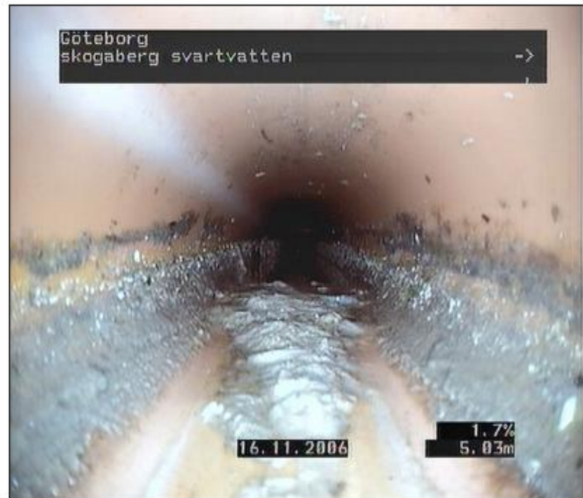
Figur 5.7 Bild på svartvattenledning med avlagring på rörväggen i höjd med vattengång.